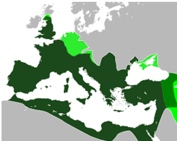
Figuur 1: Het Romeinse Rijk incl. tijdelijke gebieden

Caesar was tijdens zijn veroveringen “gewoon” een generaal. In theorie moest hij verantwoording afleggen aan de officiële machthebbers in Rome: de senaat die bestond uit enkele honderden mannen, allen uit extreem rijke families. In praktijk gedroeg Caesar zich echter als een alleenheerser, en dat werd hem niet in dank afgenomen: op 15 maart in 44 v.Chr. werd hij door een groep mede-senatoren voor het oog van iedereen vermoord. Tegelijkertijd ontstond er toch ook een breder maatschappelijk draagvlak voor een alleenheerschappij: mensen zagen dit een efficiëntere manier om het enorme rijk te kunnen regeren. Augustus trok, net als zijn adoptiefvader, veel macht naar zich toe, maar kon op meer acceptatie van de maatschappij heersen. Hij geldt als de eerste keizer. Dit