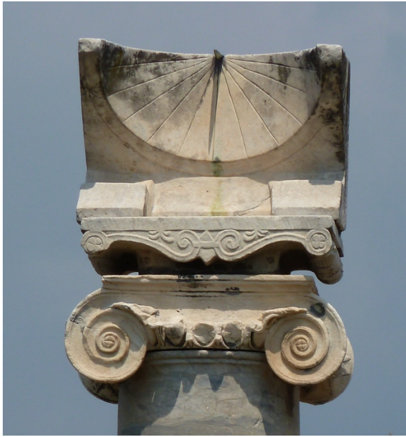
Figuur 4: Zonnewijzer uit Pompeï.

schaduw duidt de tijd van het jaar aan (waarbij de langste schaduw van het jaar tijdens de winterzonnnewende voorkomt, en de kortste tijdens de zomerzonnnewende).